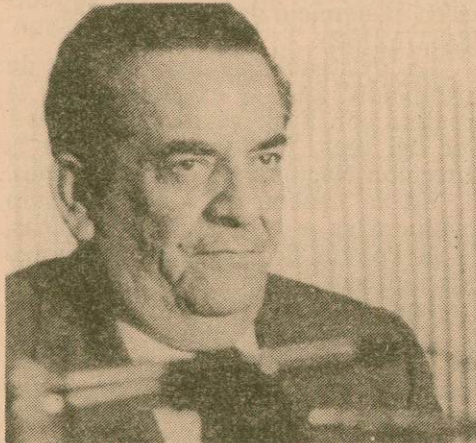
Suazo Córdova no ha podido frenar la crisis en 1982.

En lo que podríamos llamar la oposición no legal tendríamos que reseñar la incapacidad de unirse de la izquierda. Aunque en algunos temas (solidaridad con El Salvador o Nicaragua, condena de la represión) hay un acuerdo común mayor del que existía en otros tiempos, no se ha logrado todavía una cierta unidad mínima de acción. Los análisis sobre la crisis del país son con frecuencia demasiado generales. Se condena de un modo absoluto al actual régimen y se explica muy mecánicamente la neutralización del movimiento popular. El Frente de Unidad Popular 25 de Junio (FUP-25), que parecía ofrecer una esperanza de coordinación entre diferentes organizaciones de izquierda, se vió demasiado pronto limitado en la participación de los diferentes grupos que lo componen. El Funacamh ha perdido fuerza.